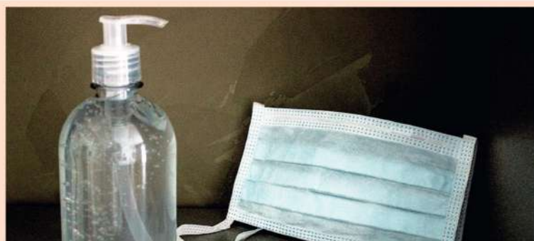
Álcool gel 70% e máscara descartável.

https://www.gov.br/anvisa/pt-br/assuntos/noticias-anvisa/2022/anvisa-reitera-a-importancia-do-uso-de-mascaras-em-ambientes-aeroportuarios/SEI_ANVISA1801927 NotaTecnica.pdf