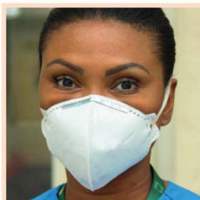
Enfermeira do INI, utilizando máscara N95.

Renata Dalavia e Ana Paula Alcides: As recomendadas pelos especialistas para fazer frente às novas variantes do SARS-CoV-2 são as profissionais PFF2, KN95, N95, classificadas com as "mais protetoras possíveis" para prevenir as infecções pelo vírus. O modelo cirúrgico ainda é indicado para a proteção da população, mas um estudo alemão mostrou que ele nem sempre vai permitir o ajuste adequado e, ainda de acordo com esta pesquisa, o uso correto impacta na transmissão. Máscaras com filtro FFP2 justas oferecem proteção 75 vezes maior do que as cirúrgicas bem ajustadas. Já as de tecido possuem baixa capacidade de filtração, não oferecendo a proteção mais adequada. Mas quando associadas a uma máscara cirúrgica, protegem mais.