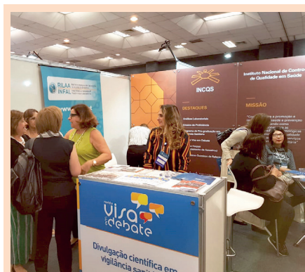
Participação da revista no ENAAL 2019, em Florianópolis (SC).

“É a única revista que tem como tema a vigilância sanitária. Sua missão é publicar textos originais que contribuam para o estudo e o desenvolvimento desta área e de disciplinas afins.”