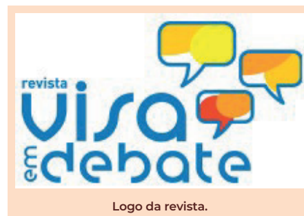
Logo da revista.

desenvolvimento desta área e de disciplinas afins, com o objetivo de disseminar conhecimentos aplicáveis ao campo da promoção da saúde, da prevenção de doenças e outros agravos à saúde, bem como da estruturação, organização e funcionamento do Sistema Único de Saúde (SUS) no âmbito da regulação do risco sanitário.